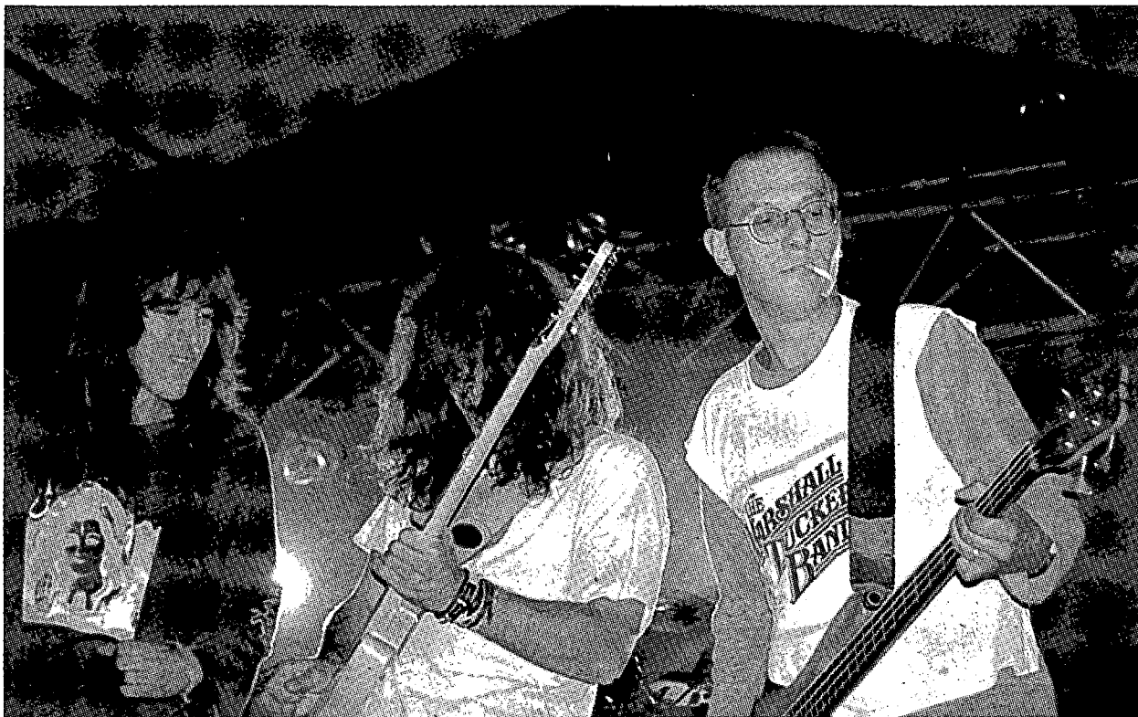
Sopa de Cabra, en un concert recent a Santa Coloma de Farners.